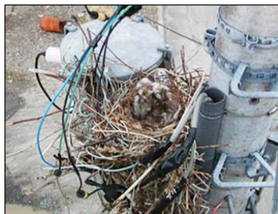
【電柱上のカラスの巣】