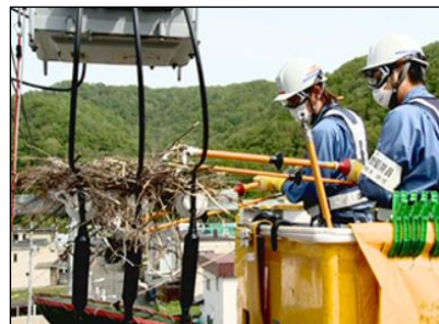
【ホットスティックを使ったカラスの巣の撤去作業】